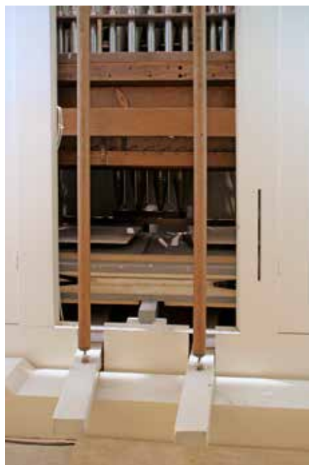
De oude balanstrapinstallatie midden achter de orgelkast.

Bij de restauratie van de gecombineerde lade werd deze aan onder- en bovenzijde voorzien van nieuw schapeleer. Aan de frontzijde werd een kantsleep aangebracht voor de Cornet 4 st discant en aan de achterzijde een kantsleep voor de nieuwe Dulciaan 8 vt. De sleepbanen kregen leerstroken waarop, evenals onder de eiken pijpstocken, geweven Liegelind-ringen werden aangebracht. Er werden nieuwe ventielveren aangebracht. Bij de restauratie van de klaviatuur zijn nieuwe porseleinen registerschildjes geheel in stijl van Witte vervaardigd. De metalen delen van de mechanieken (o.a. welarmpjes en zwaarden) werden ontroest en opnieuw gezwart. Ook werd de forte-