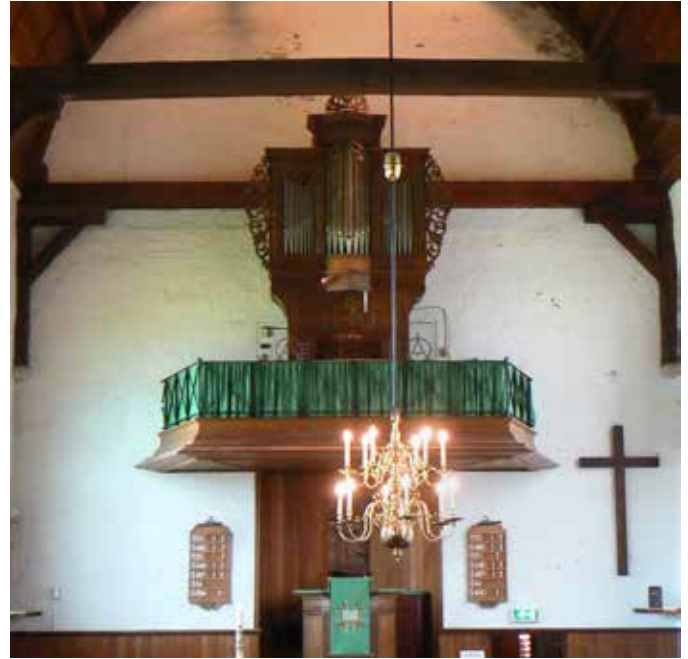
Het Weidtmann-orgel in de situatie voor de kerkrenovatie. De orgelgalerij, tevens het klankbord boven de kansel, is nog omfloerst met groene gordijntjes. Na de renovatie werd de balustrade van glas met gekleurde sculpturen voorzien.

1580 werden – bij herstel van de kerk – de noordbeuk en het noordkoor afgebroken. De preekstoel dateert van 1606. Bij een grote verbouwing in 1737 werden o.a. het hoogkoor en het ‘Catharijnenkoor’ afgebroken, waarbij de kerk zijn huidige vorm kreeg. In 1906 werd aan de oostzijde een consistorie aangebouwd. Op 2 november 1944 werd bij de bevrijding van Zoutelande de kerk ernstig beschadigd. Een groot gat in het dak, totale verwoesting van de consistorie en ernstige schade aan ramen en steunberen leidden tot een restauratie van 1947 tot 1950. Daarbij werd o.a. het gehele dak gerenoveerd en werd het tongewelf binnen weer zichtbaar. Daarbij werd in 1950 ook