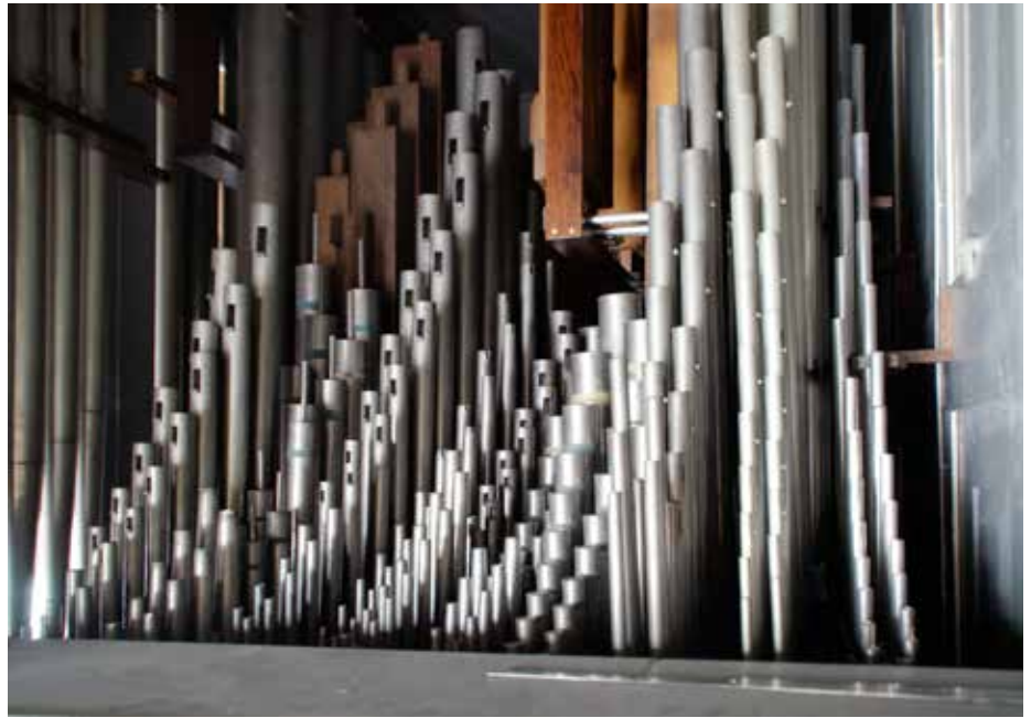
Gezicht vanaf de klaviatuur op het pijpwerk op de gecombineerde windlade.

De vernieuwde Catharinakerk heeft een 'nieuwe' Witte. Op 25 april 2015 werd het orgel feestelijk ingebruik genomen met o.a. een toelichting en