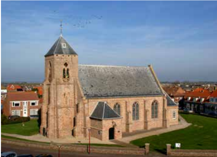
De Catharinakerk is het gezichtsbepalende monument van Zoutelande.

welke in 1580 vervangen werd door een achthoekige spits en later door de huidige piramidevormige bekroning. Ooit was de kerk als hallenkerk wel viermaal groter dan de huidige kerk. Dit bleek o.a. tijdens de afgravingen van het kerkhof in 1932. Het daarbij vrijgekomen zand werd in dat jaar door de kerkenraad verkocht en werd gebruikt om de weg naar Westkapelle en Biggekerke te verbreden. Bij die afgravingen kwamen oude funderingen bloot te liggen.