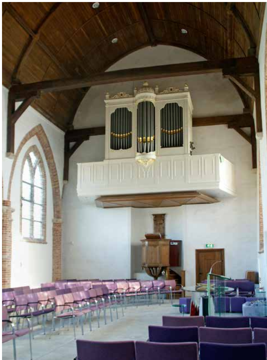
Het Witte-orgel in het gerenoveerde interieur van de Catharinakerk. Onder de nieuwe orgelgalerij is het oude klankbord van de kansel gehandhaafd. Het 'stoelenplan' is een kwart slag gedraaid gericht op het liturgisch centrum rechts op de foto.

In 1957 werd een nieuw Seminarie gerealiseerd aan de Koningin Wilhelminalaan in Amersfoort. Momenteel zijn in dit gebouw o.m. het Bisschop-