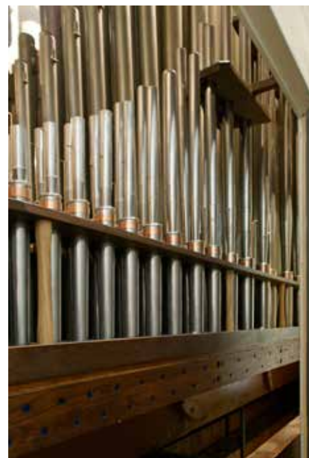
De gereconstrueerde Dulcian 8 vt, op een kantsleep aan de achterzijde van de gecombineerde windlade.

Na plaatsing werd de winddruk op 82 mm Wk vastgesteld. Waar nodig werd de intonatie van de pijpen qua aanspraak en egaliteit gecorrigeerd. De toonhoogte van a^1 = 440 Hz werd gehandhaafd, evenals de stemming in evenredig zwevende temperatuur. Het orgel heeft nu volgende dispositie.