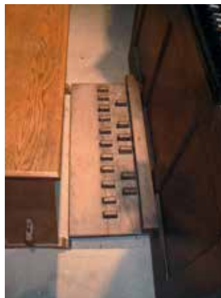
Zowel op het manuaal als op het ‘Franse’ kistpedaal ontbreekt de toets Cis.